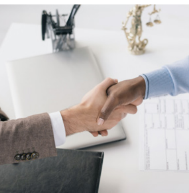
Reform der Altersvorsorge → S.16